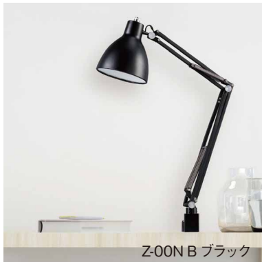
Z-00N B ブラック