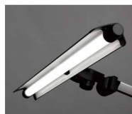
Z-208LED SL シルバー