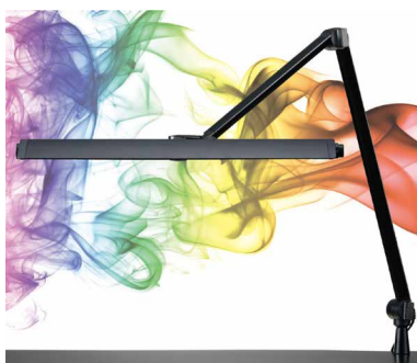
Z-208PRO B ブラック / Z-209PRO B ブラック