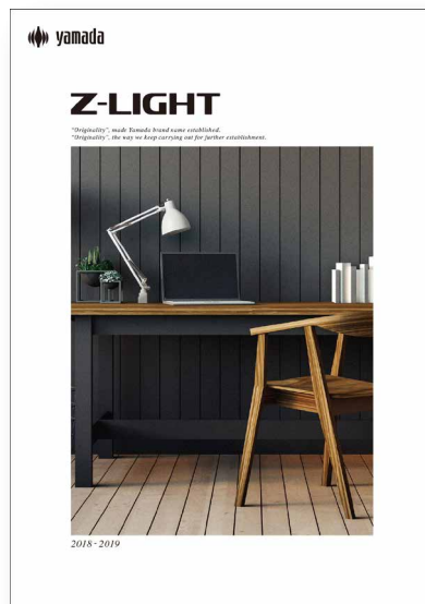
Z Light 2018-2019

伝統を継承し、さらに使いやすさを追求する Z ライト、並びに山田照明にさらなるご支援を賜りますようお願い申し上げます。