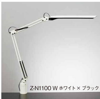
Z-N1100 W ホワイト× ブラック

光源：LED 4.7W 白熱 40W相当 色温度固定型 (4000K) Ra90 中心直下照度：691 lx 材質：銅、樹脂 重量：1.2kg