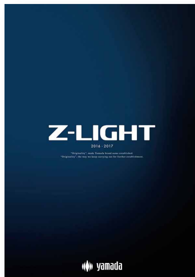
Z Light 2016-2017