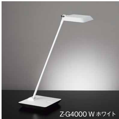
Z-G4000 W ホワイト