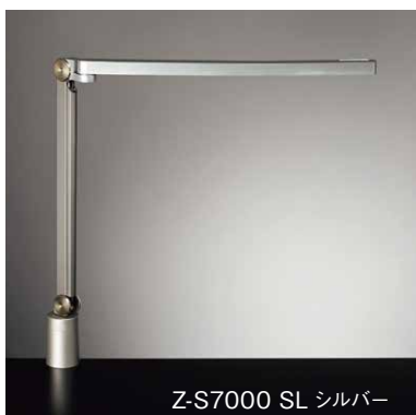
Z-S7000 SL シルバー

光源：LED 7.0W 白熱 80W相当 色温度段階調光 Ra80 中心直下照度：1,540 lx (5000K) 材質：銅、樹脂 重量：0.9kg